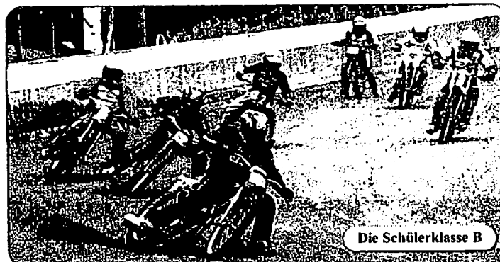
Die Schülerklasse B