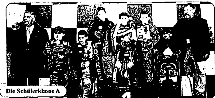
Die Schülerklasse A